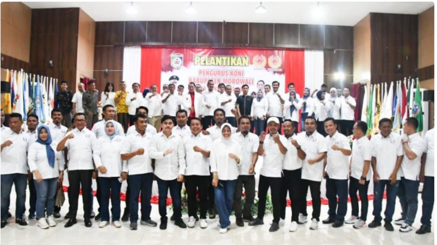
Pj Bupati Morowali bersama jajaran pengurus KONI yang baru d lantik